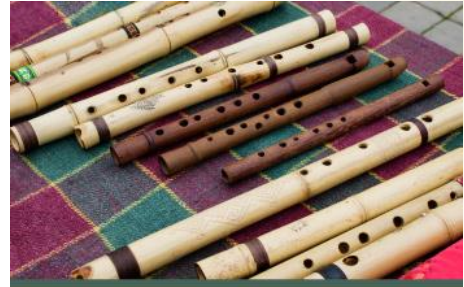
אמת או שקר

השלט הענק שהתנוסס מעל הטירה העתיקה, משך את עיני המטיילים הרבים. כאן אומרים אמת' היה כתוב בשלט מרשים שהתנוסס מעל שער הכניסה. הייתה זו טירה מבודדת שהתנוססה בראשו של אחד מההרים הגבוהים שבהרי הגהט. בית ספר פעיל היה בטירה שהונהג על ידי הנזיר הזקן מוקהיטו, שמעו של בית הספר הגיע אף למחוזות המרוחקים. בניגוד למקומות לימוד אחרים, כאן לא היה קושי להתקבל ללימודים, אצל הנזיר הזקן כל תלמיד זכה ליחס מיוחד. אך לא רבים הצליחו להישאר במחיצתו לאורך זמן, עקב דרישתו העקבית והבלתי מתפשרת - לא לשקר. כל תלמיד שנתפס בשקר, נאלץ לארוז את מטלטליו ולעזוב את המקום בהקדם. ידוע היה, כי אצל מוקהיטו אין אפילו סיכוי קלוש לשנות את רוע הגזרה, הוא נותר בעקביותו נאמן להחלטתו להרחיק מעליו את אלו שאינם מסוגלים לומר את האמת.