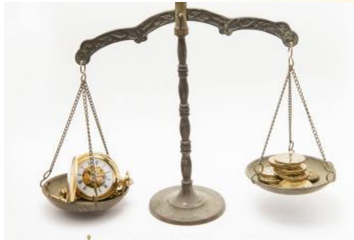
זכייה בערבון מוגבל