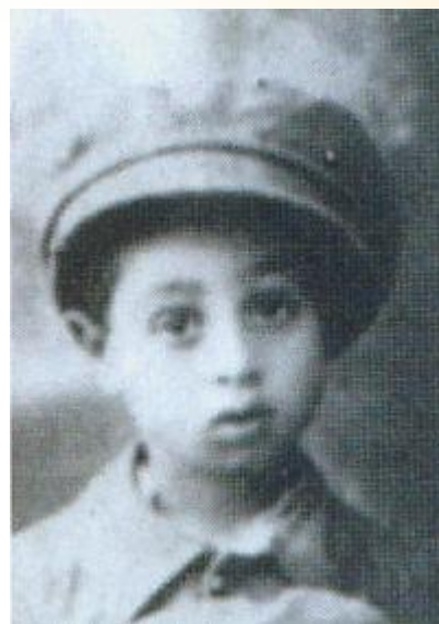
עובדיה יוסף בילדותו