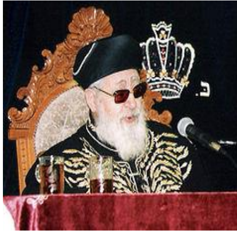
הרב עובדיה יוסף זצ"ל

י"ב בתשרי ה'תרפ"א, (23/09/1920), בגדאד – ג' בחשוון ה'תשע"ד, (07/10/2013), ירושלים)