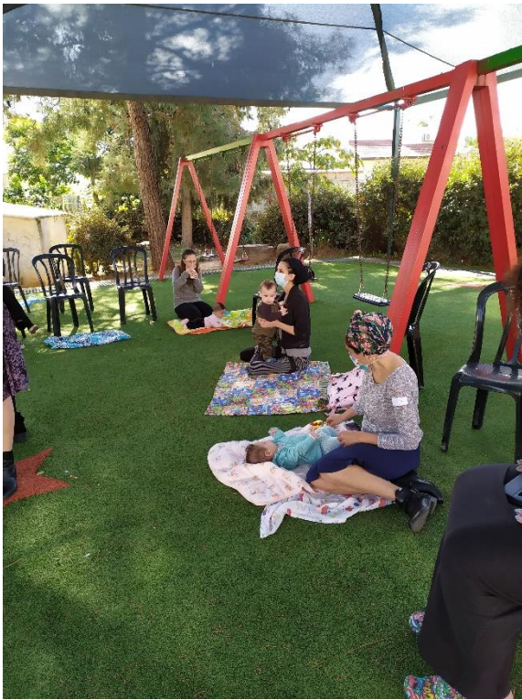
חולצות אק אק