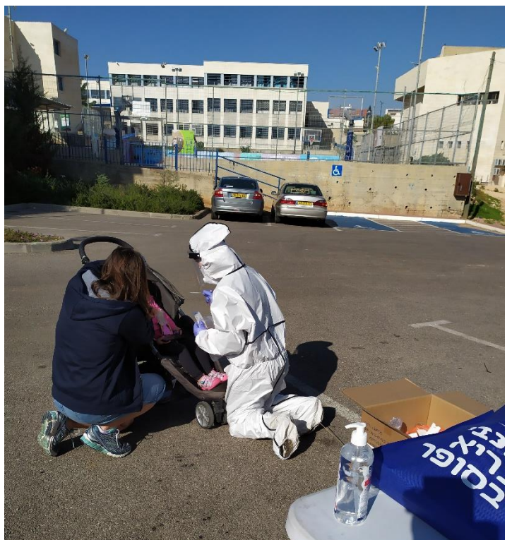
בדיקות קורונה בילוב