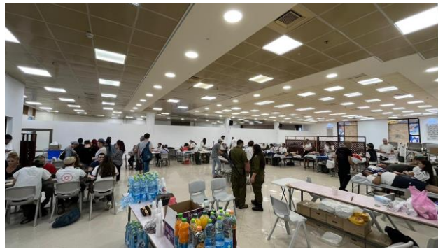
התרמת דם יישוב חשמונאים - 1