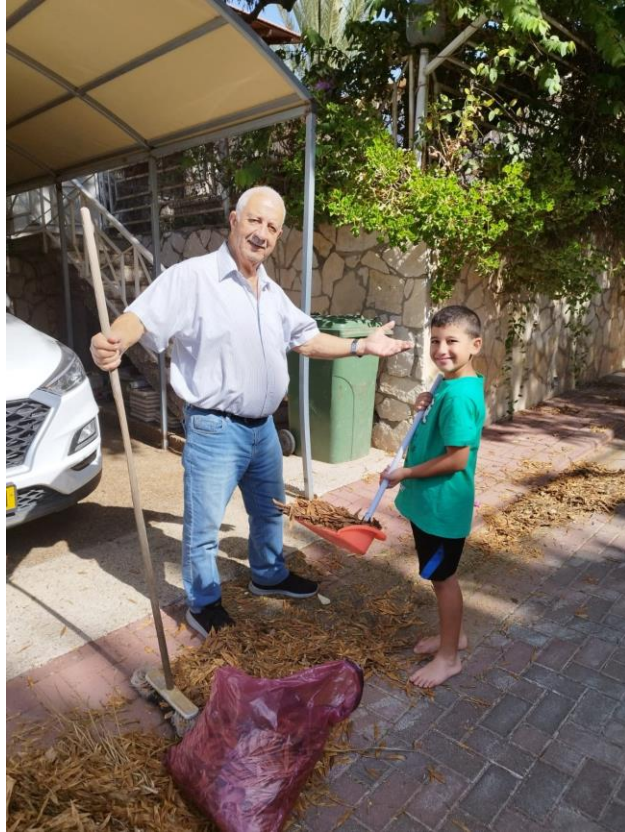
מנקים - 9