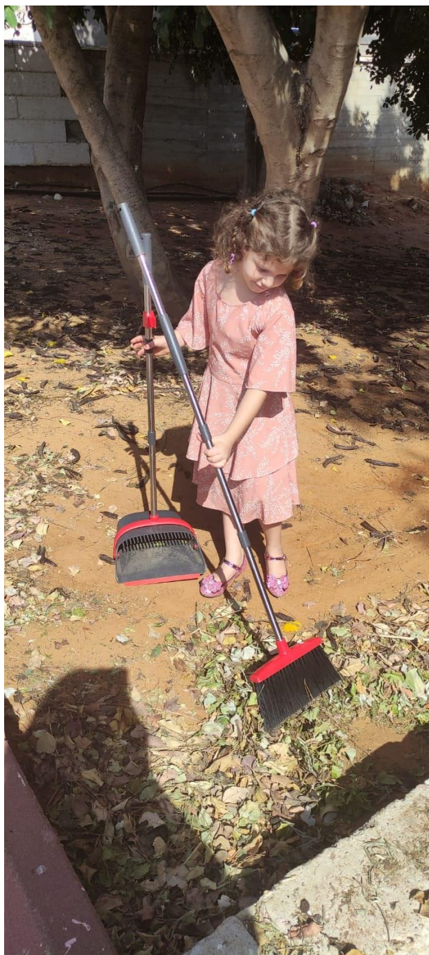
..מנקים - 11