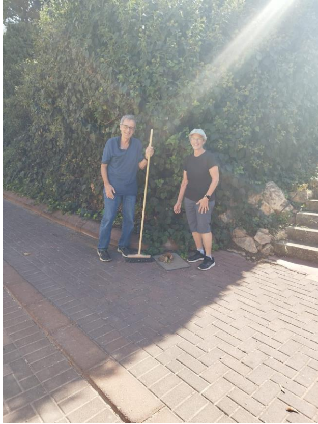
מנקים - 7