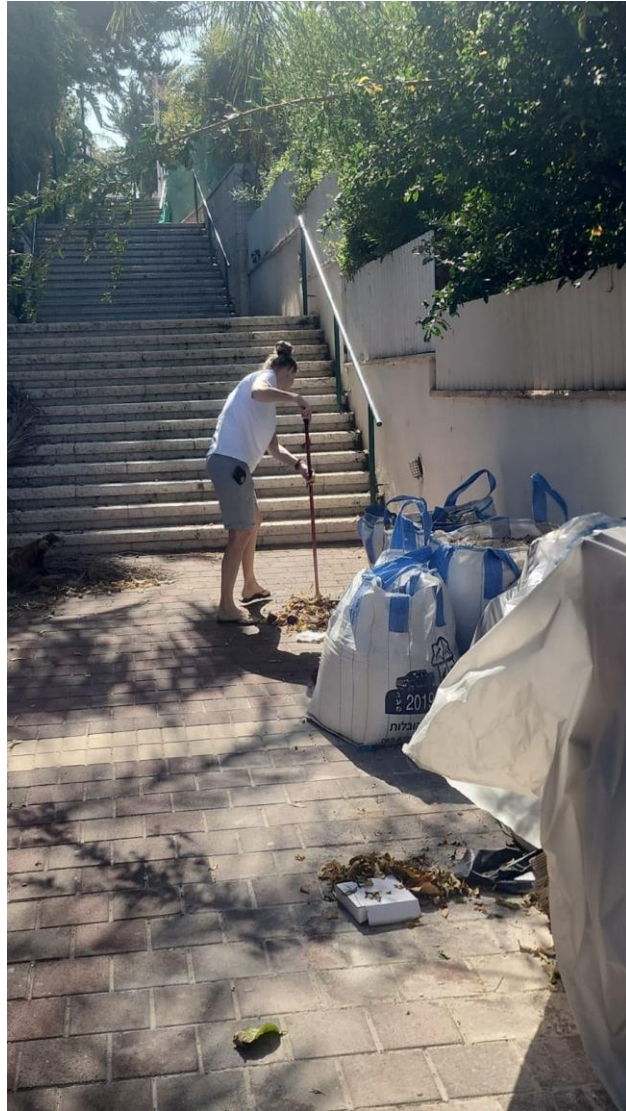
מנקים.. היידה פנייתו! - 4