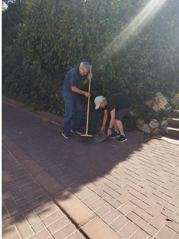
מנקים - 8