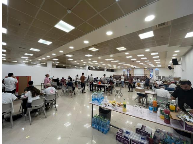
התרמת דם יישוב חשמונאים - 2