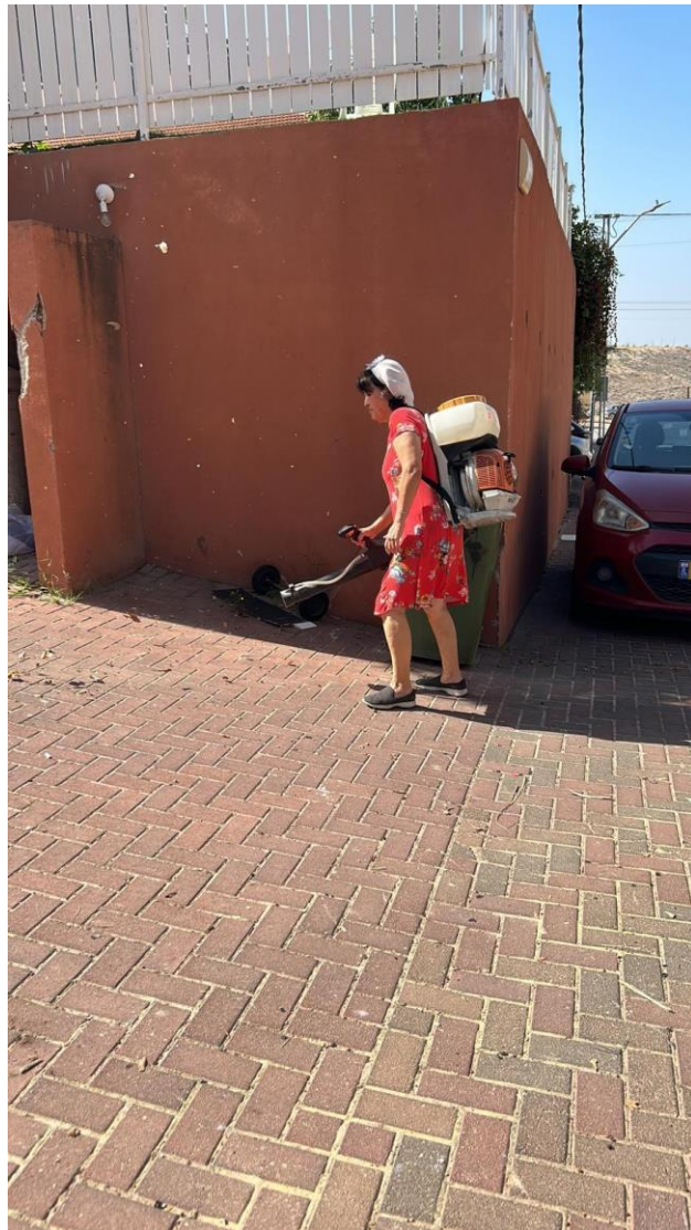
..מנקים - 5