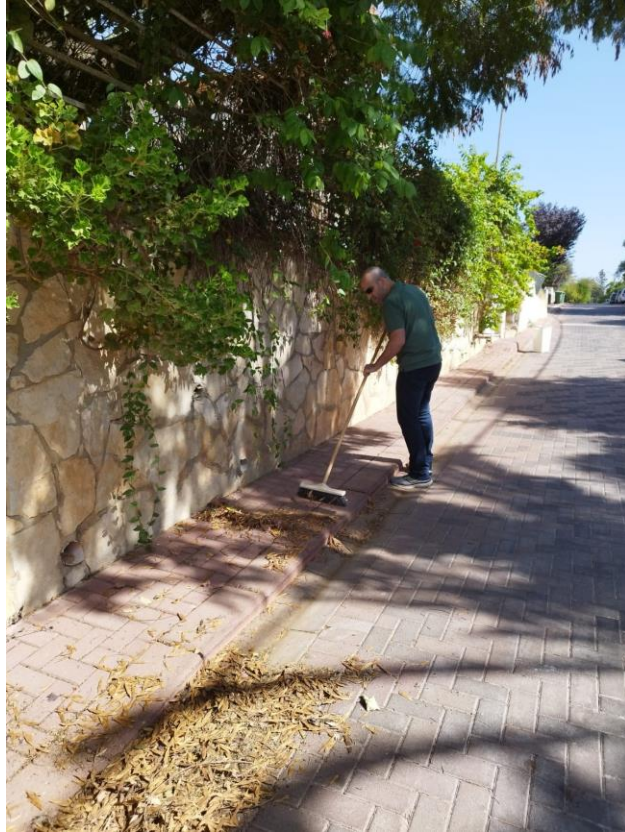
10 - מנקים..