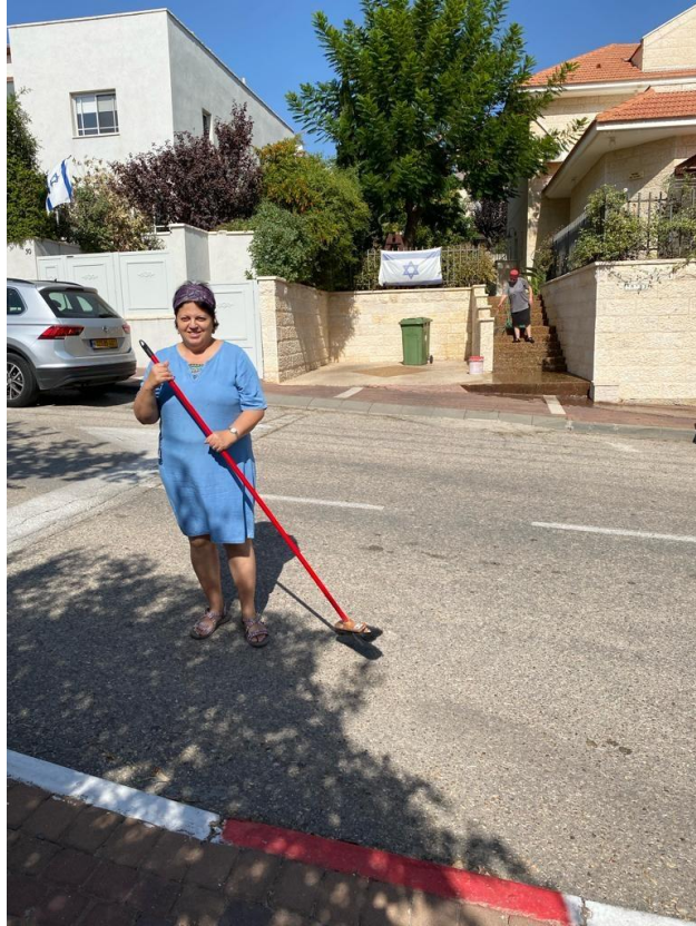
מנקים - 6