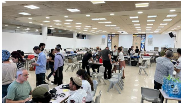
התרמת דם יישוב חשמונאים - 3