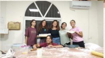
חמישי סוף אצל מדר