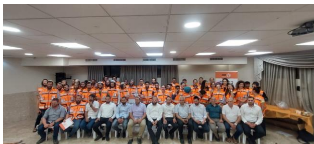
ערב פרידה מאיראלה הקומונרית