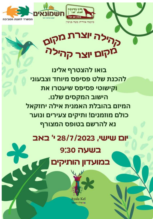
להרשמה 2 - 1